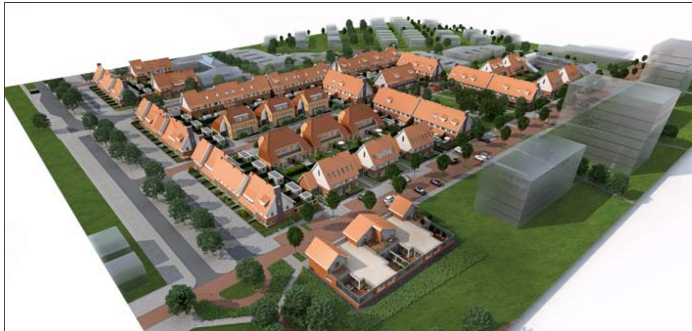
Vogelvlucht met vooraan de patiowoningen in de kanaalzone

De woningen zijn aangesloten op stadsverwarming met radiatoren en convectoren voor de warmteafdracht. Ze hebben hierdoor geen c.v.-ketel nodig. Dit bespaart weer enkele vierkante meters. Ventilatie vindt plaats via natuurlijke ventilatie en mechanische afzuiging.